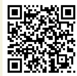
花蓮交通e點通官網

來到花蓮旅遊若要以公車代步可以透過「 花蓮交通e點通 」查詢您想知道的公車資訊！